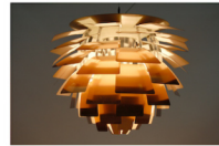
Suspension "orchidée" composée d'une succession de feuilles en acier cuivré disposées en épi formant cache ampoule et attirant la lumière. Eaton Louis Poulsen, vers 1960.