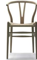
1950 chaise "Y" model No 24