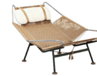
1950 Fauteuil "Flag"