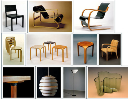
Auditorium chair 611, 1929 - Paimio chair, 1932 - Armchair 42, 1932. Stool 60, 1933 - Stool Y 61, 1946, - Stool X 602, 1954 - Armchair 45, 1947. Table H 94, 1956, Light, 1953 - Light Angel's wing, 1956 - Savoy vase, 1936