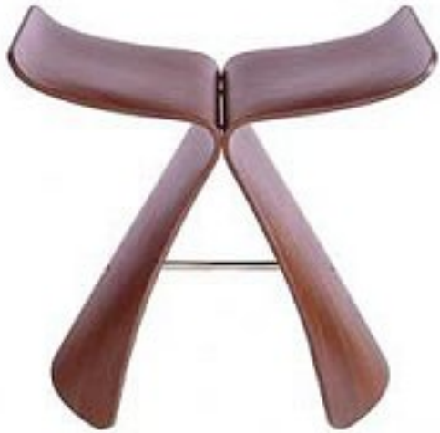
Tabouret, contreplaqué moulé, 1954