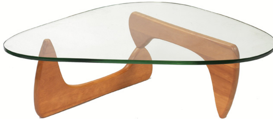
Lampe de sol "Akari" Table basse, 1951