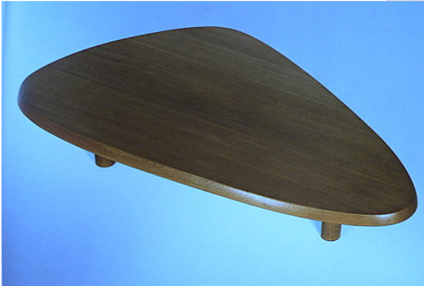
Table basse, plateau en bois massif de cyprès hinoki, fabrication atelier Miyoshi, Tokyo (1954)