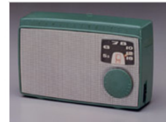
1955, TR55 transistor