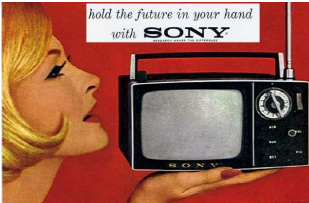
TV5-303, en 1960.