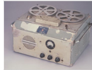
1950 G-Type, enregistreur à cassettes

formes inspirés du matériel de guerre américain et miniaturisation